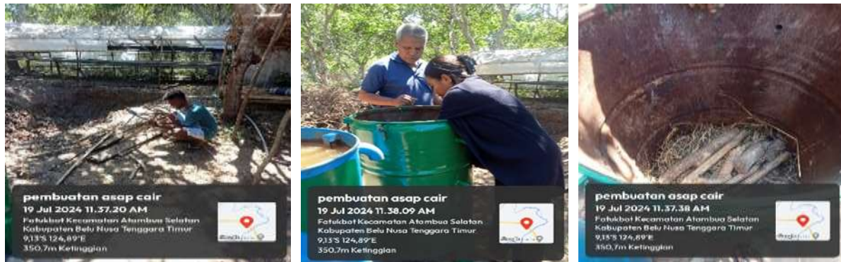
Gambar 2. Persiapan Bahan Baku dan Pengisian Dalam Tong