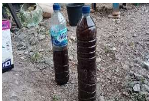
Gambar 5. Pengemasan Cairan Asap Cair

Cairan yang sudah di tampung diisi pada botol aqua ukuran 1500 ml. Kemudian untuk penggunaannya harus didiamkan minimal 7 hari (168 jam). Semakin lama disimpan cairannya akan mengental dan sangat baik untuk tanaman. Cairan yang sudah disimpan selama 7 hari bisa langsung diaplikaasikan pada tanaman.