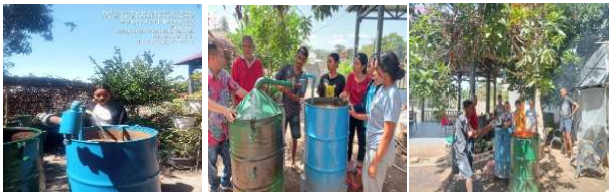
Gambar 3. Proses Pembuatan Asap Cair

Proses produksi asap cair berjalan dengan sendirinya. Bahan baku yang berada dalam tabung mulai terbakar akan menghasilkan asap sehingga tekanan semakin meningkat. Saat tekanan meningkat, udara mengalir dari tabung pengatur udara menuju reaktor. Udara dari sekitar tungku dan ruang celah pipa (suhu rendah) secara perlahan bergerak meniup asap sehingga masuk ke pipa-pipa kondensor. Asap cair dibuat dengan bahan yang mengandung zat kayu (lignin), komponen struktur sel tanaman (selulosa dan hemiselulosa), dan senyawa arang (karbon) (Utomo et al., 2012).