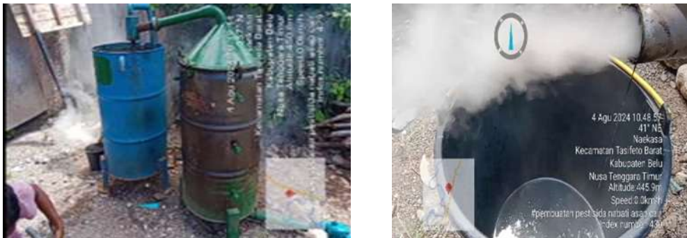
Gambar 4. Penampungan Cairan Asap Cair

Cairan yang dihasilkan keluar melalui sistem pipa dan di tampung di wadah berupa ember. Asap yang dihasilkan dikumpul dengan menggunakan sistem pipa untuk menangkap asap dari tong (ruang) pembakaran. Sistem ini juga terdapat alat penyaring untuk memisahkan partikel padat dari gas asap. Pada bagian penyaringan ini menghasilkan cairan berupa ter atau disebut juga tar.