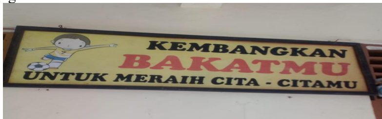
Gambar 4. Ungkapan Hikmah di SDN 02 Kembang, Kabupaten Boyolali

Daya juang yang relevan untuk anak usia SD yaitu semangat dalam memperoleh ilmu/belajar. Anak usia SD yang menginginkan mendapat juara kelas, memenangkan perlombaan, meneruskan pendidikan lebih tinggi harus berjuang dengan gigih. Prestasi tak dapat diraih tanpa semangat. Ungkapan hikmah tersebut bermakna bahwa jika ingin melahirkan sebuah prestasi yang besar, maka butuh perjuangan yang besar pula. Ungkapan hikmah di atas termasuk dalam nilai pendidikan mandiri dengan daya juang yang besar. Untuk mencapai prestasi yang besar diperlukan semangat yang tinggi, semangat dalam mencari ilmu dan belajar. Apabila motivasi belajar semakin ditingkatkan, maka prestasi belajar yang dicapai siswa akan semakin baik (Mawarsih, dkk., 2013: 9-10). (4). Peserta didik perlu mempunyai karakter kreatif. Kreatif adalah kemampuan untuk menciptakan sesuatu yang baru yang unik dan mempunyai nilai guna. Balitbang (dalam Wahyuni & Mustadi, 2016: 247) pendidikan budaya dan karakter bangsa disebutkan bahwa karakter kreatif bermakna berpikir dan melakukan sesuatu untuk menghasilkan cara atau hasil baru dari sesuatu yang telah dimiliki.