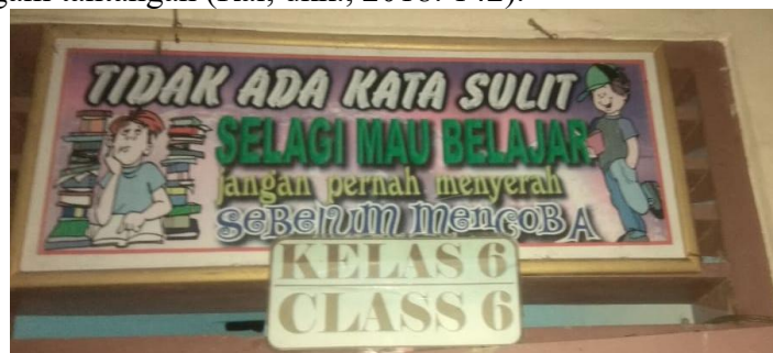
Gambar 2. Di SD Negeri 3 Jembungan, Kabupaten Boyolali.

Etos kerja yang dimaksud di sini yaitu etos belajar yang berkaitan dengan anak usia SD yaitu giat belajar. Jika ingin menjadi pintar harus selalu rajin belajar. Tidak ada orang pintar yang malas belajar merupakan ungkapan hikmah yang mengandung makna bahwa orang yang pintar, memiliki etos akan terus belajar. Semakin anak pintar, maka semakin tahu bahwa anak tak berilmu itu malas belajar. Selalu belajar merupakan salah satu karakter kerja keras yaitu berusaha untuk mendapatkan ilmu dengan sungguh-sungguh, serta penuh semangat. Belajar di usia anak SD yaitu selalu mengerjakan tugas, membaca buku pelajaran, dan latihan mengerjakan soal-soal. Anak menjauhi sikap bermalas-malas atau karena ingin bermain dengan teman-teman. Seperti dijelaskan Wuryanti & Kartowagiran (2016: 235) bahwa kerja keras dapat dibentuk melalui latihan ketekunan untuk mencapai tujuan belajarnya. Semakin anak terus belajar semakin besar karakter kerja keras terbentuk dalam diri. (2). Tangguh adalah sikap dan karakter yang ditandai dengan pantang menyerah dalam menghadapi masalah apapun dan kuat dalam menghadapi semua rintangan. Karakter tangguh merupakan karakter yang mampu dengan mantap dan tidak tergoyahkan saat menghadapi beragam tantangan (Rai, dkk., 2018: 142).