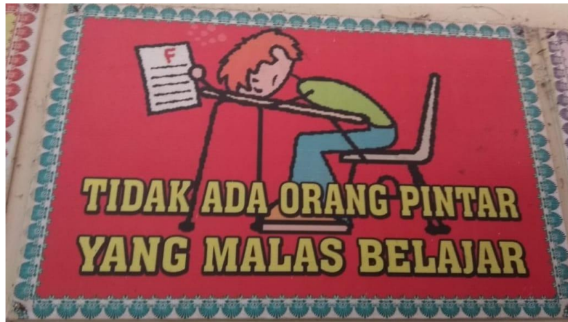
Gambar 1. Ungkapan Hikmah di SDN 02 Dukuh, Kabupaten Sukoharjo.

Etos kerja yang dimaksud di sini yaitu etos belajar yang berkaitan dengan anak usia SD yaitu giat belajar. Jika ingin menjadi pintar harus selalu rajin belajar. Tidak ada orang pintar yang malas belajar merupakan ungkapan hikmah yang mengandung makna bahwa orang yang pintar, memiliki etos akan terus belajar. Semakin anak pintar, maka semakin tahu bahwa anak tak berilmu itu malas belajar. Selalu belajar merupakan salah satu karakter kerja keras yaitu berusaha untuk mendapatkan ilmu dengan sungguh-sungguh, serta penuh semangat. Belajar di usia anak SD yaitu selalu mengerjakan tugas, membaca buku pelajaran, dan latihan mengerjakan soal-soal. Anak menjauhi sikap bermalas-malas atau karena ingin bermain dengan teman-teman. Seperti dijelaskan Wuryanti & Kartowagiran (2016: 235) bahwa kerja keras dapat dibentuk melalui latihan ketekunan untuk mencapai tujuan belajarnya. Semakin anak terus belajar semakin besar karakter kerja keras terbentuk dalam diri. (2). Tangguh adalah sikap dan karakter yang ditandai dengan pantang menyerah dalam menghadapi masalah apapun dan kuat dalam menghadapi semua rintangan. Karakter tangguh merupakan karakter yang mampu dengan mantap dan tidak tergoyahkan saat menghadapi beragam tantangan (Rai, dkk., 2018: 142).