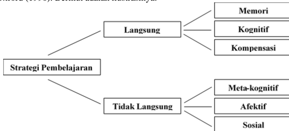
Gambar 1 . Strategi Pembelajaran Bahasa diadaptasi dari Oxford 1990

memahami suatu materi pembelajaran. Strategi pembelajaran tersebut masuk kedalam dua jenis pengelompokan yang berbeda, yaitu pembelajaran langsung ( direct learning ) dan pembelajaran tidak langsung ( indirect learning ). Untuk selanjutnya strategi langsung dikategorikan menjadi tiga bagian yaitu Memori, Kognitif dan kompensasi. Sedangkan pembelajaran tidak langsung dibagi juga kedalam tiga jenis berbeda yaitu meta-kognitif, afektif dan sosial. Pengelompokan strategi pembelajaran Bahasa ini mengikuti klasifikasi yaitu Oxford (1990). Berikut adalah ilustrasinya.