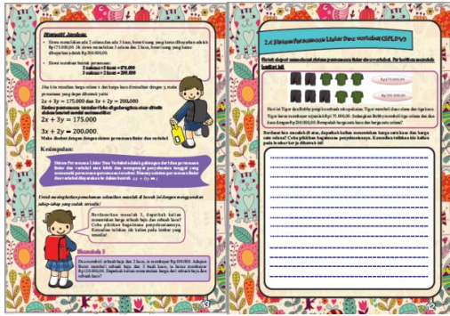
Gambar 4 Tampilan Bahan Ajar

Pada uji coba validasi bahan ajar, ada 3 validator yaitu tiga validator meliputi ahli materi, ahli desain pembelajaran, dan ahli praktisi.