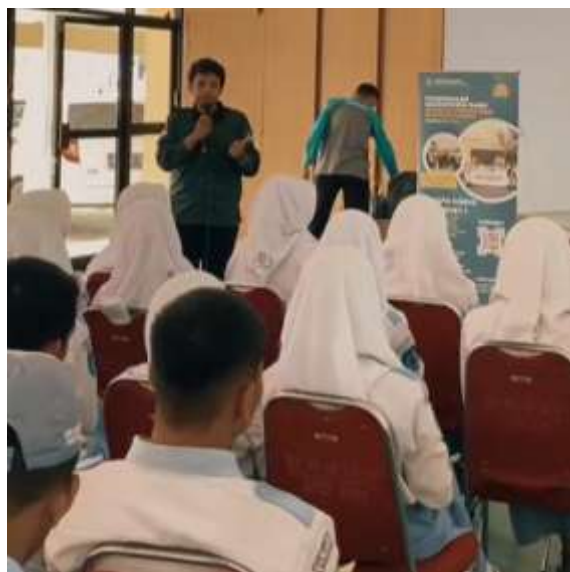
Gambar 2. Sosialisasi kegiatan pembuatan Pupuk POC