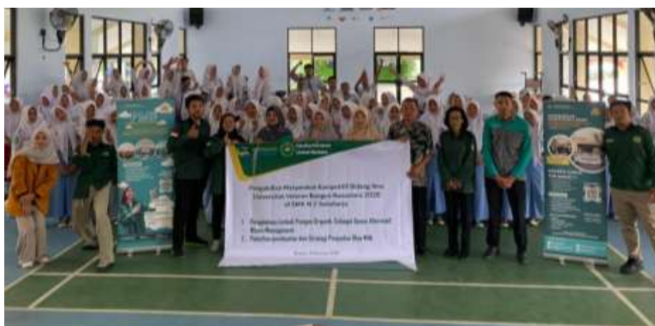
Gambar 3. Sosialisasi Bersama Siswa Siswi SMK N 2 Sukoharjo