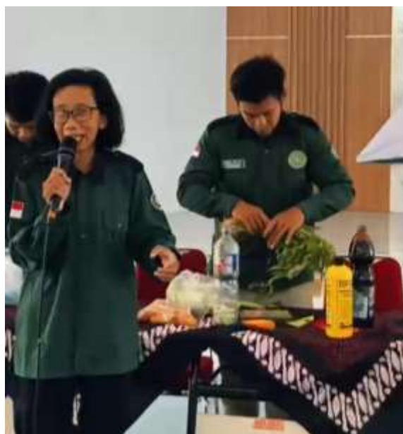
Gambar 1. Pelatihan pembuatan Pupuk POC

Tahapan Pelatihan ini dilakukan bimbingan oleh tim dalam pembuatan pupuk cair bersama, yakni menyangkut bagaimana cara membuat serta alat - alat yang digunakan sebagai penunjang pembuatan produk pupuk cair. Pada tahap demonstrasi ini, tim pelaksana memperagakan secara langsung langkah-langkah pembuatan POC. Limbah pangan yang telah busuk dicacah halus, kemudian dicampur dengan air, gula merah/molase, dan aktivator EM4 dalam wadah tertutup untuk proses fermentasi selama 7-14 hari. Peserta diperkenalkan cara menentukan perbandingan bahan yang tepat dan cara menjaga kebersihan wadah agar fermentasi berlangsung optimal. Selanjutnya, tahap praktik mandiri dilakukan dengan membagi peserta ke dalam beberapa kelompok kecil. Setiap kelompok melakukan pembuatan POC secara langsung berdasarkan panduan yang telah diberikan. Tim pelaksana mendampingi proses tersebut untuk memastikan ketepatan prosedur dan keamanan selama praktik berlangsung. Dari hasil observasi, seluruh peserta mampu menyelesaikan tahapan praktik ini dengan baik.