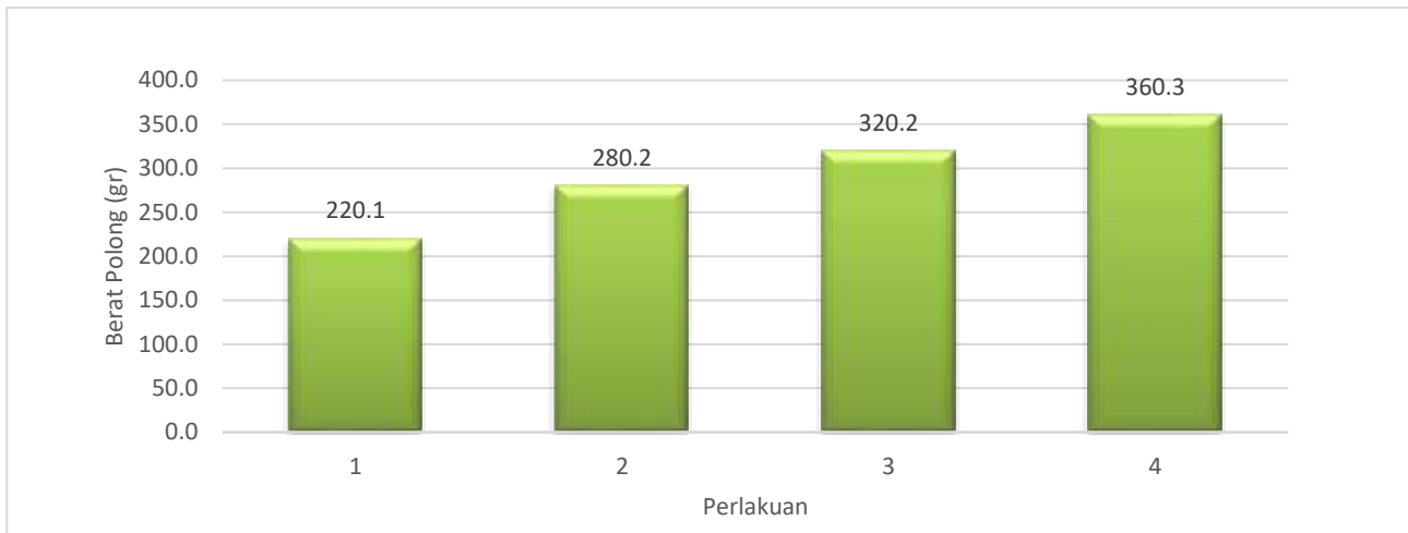
Gambar 4. Diagram Rata – rata Berat Polong Tanaman Kacang Tanah ( Arachis hypogaea )