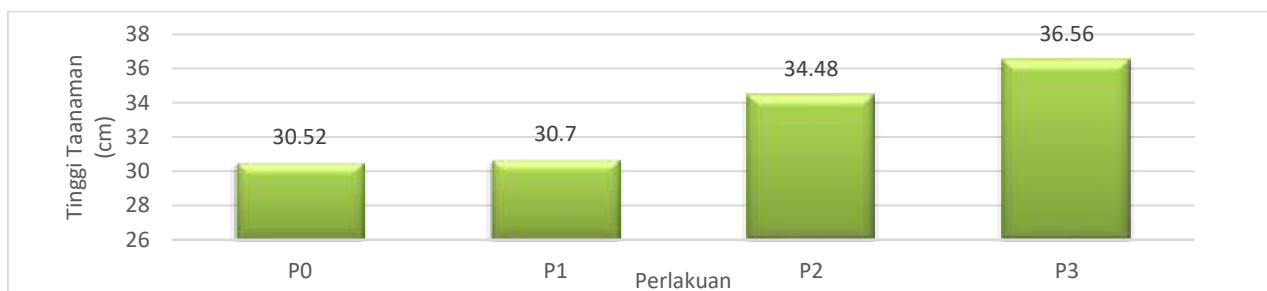
Gambar 1. Diagram Rata – rata Tinggi Tanaman Kacang Tanah ( Arachis hypogaea )

Tinggi tanaman merupakan salah satu indikator pertumbuhan vegetatif yang mencerminkan kemampuan tanaman dalam memanfaatkan unsur hara dan kondisi lingkungan tumbuh. Hasil pengamatan rata-rata tinggi tanaman kacang tanah pada berbagai perlakuan disajikan pada Gambar 1.