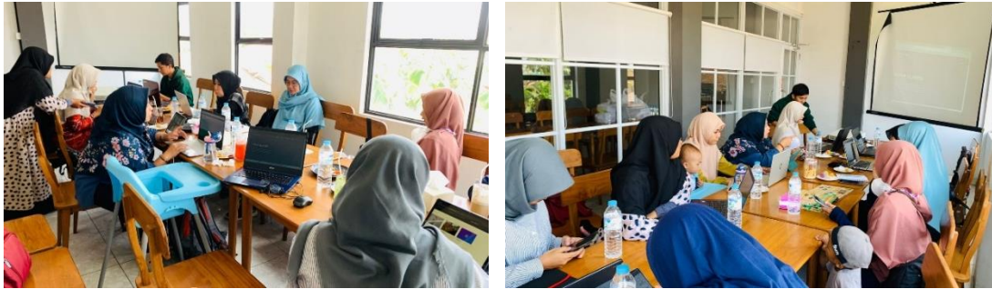
Gambar 3. Proses Pendampingan Pembuatan dan Penyusunan Konten Website

dan APUNA Kabupaten Klaten memberikan respon positif. Hal ini ditunjukkan dengan adanya beberapa konten yang berhasil disusun pada waktu pelatihan. Selain itu ada dua orang anggota yang bersedia mengelola website sehingga website selalu menampilkan informasi terkini.