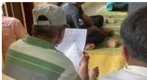
Gambar 2. Pelaksanaan Pre-test

Kegiatan diawali dengan pelaksanaan pre-test untuk mengetahui tingkat pemahaman awal peserta terkait pengelolaan sampah rumah tangga dan ecoenzyme. Hasil pre-test menunjukkan bahwa sebagian peserta belum memahami secara optimal konsep ecoenzyme, bahan yang digunakan, serta manfaatnya dalam kehidupan sehari-hari. Kondisi ini selaras dengan temuan awal di lapangan bahwa sampah organik rumah tangga di Desa Juwiring belum dikelola secara mandiri.