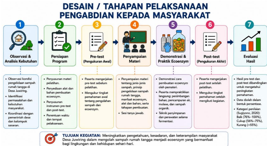
Gambar 1. Tahapan Pelaksanaan Program

Program Pengabdian kepada Masyarakat yang dilakukan oleh mahasiswa Universitas Muhammadiyah Surakarta dilaksanakan dengan menggunakan metode partisipatif. Metode ini menekankan keterlibatan aktif masyarakat mulai dari perencanaan, pelaksanaan, hingga evaluasi kegiatan. Kegiatan pengabdian ini berupa pelatihan pengelolaan sampah rumah tangga, salah satunya melalui pengolahan sampah menjadi ecoenzym.