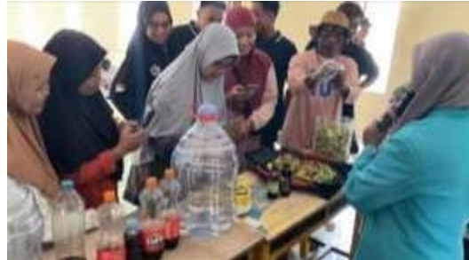
Gambar 4. Demonstrasi pembuatan ecoenzyme

Setelah penyampaian materi, kegiatan dilanjutkan dengan demonstrasi pembuatan ecoenzyme oleh fasilitator. Peserta terlihat antusias dan terlibat aktif dalam setiap tahapan kegiatan. Hal ini menunjukkan tingkat partisipasi yang tinggi, karena ibu-ibu PKK, kelompok wanita tani, serta pemuda Desa Juwiring terlibat secara langsung. Peserta tidak hanya melakukan pengamatan, tetapi juga praktik langsung penimbangan bahan berupa sampah organik, molase, dan air, serta pencampuran sesuai rasio ideal di bawah pendampingan fasilitator.