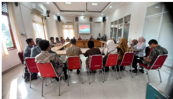
Gambar 1. Suasana kegiatan evaluasi pelatihan "Dasar-Dasar Jurnalistik dan Penerapan Kode Etik Jurnalistik"

Evaluasi efektivitas pelatihan "Dasar-Dasar Jurnalistik dan Penerapan Kode Etik Jurnalistik" dilakukan menggunakan desain pre-eksperimental dengan model one-group pre-test-post-test (Gambar 1). Pendekatan ini dipilih untuk mengukur tingkat peningkatan kognitif dan pemahaman peserta sebelum dan setelah intervensi materi. Tujuan utama dari evaluasi ini adalah untuk memvalidasi apakah metode penyampaian materi dan substansi kurikulum yang disusun mampu menjembatani kesenjangan kompetensi dasar jurnalistik di kalangan peserta. Instrumen evaluasi berupa tes objektif dengan rentang nilai 0 hingga 10 diberikan pada dua tahap, yakni sebelum pemaparan materi ( pre-test ) dan setelah seluruh rangkaian materi selesai disampaikan ( post-test ).