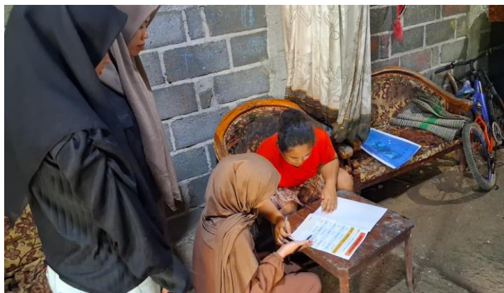
Gambar 3. Pendampingan Mitra Ibu PKK

Hasil analisis menunjukkan adanya variasi capaian pada setiap indikator literasi numerasi fungsional. Tabel 2 menyajikan persentase capaian per item angket, sedangkan Tabel 3 menyajikan perbandingan kondisi sebelum (pra-program) dan sesudah (pasca-program) untuk setiap indikator literasi numerasi fungsional.