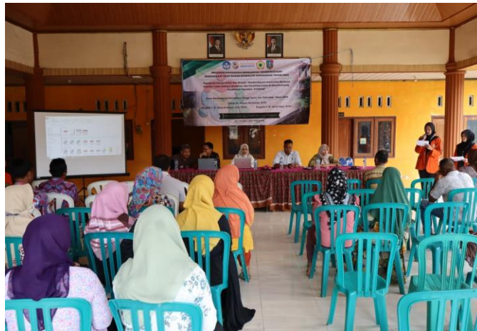
Gambar 2. Sosialisasi Program