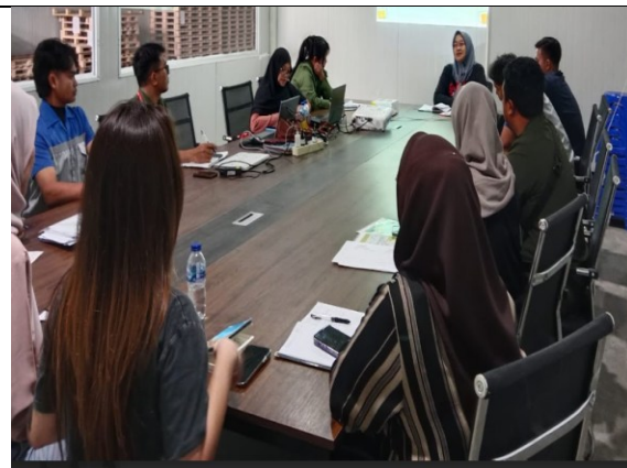
Gb 1. Sambutan Manajemen