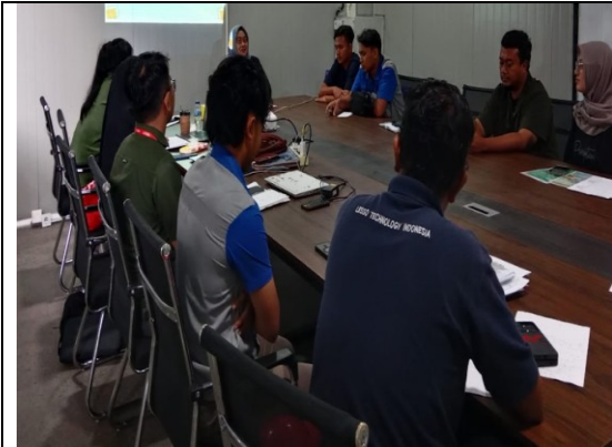
Gb 4. Diskusi hasil Audit dan Praktek Pengisian Form NCR