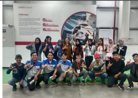
Gb 5. Foto Bersama

Proses pelaksanaan audit internal dilaksanakan dengan metode observasi dan wawancara. Proses observasi dan wawancara dibutuhkan keahlian khusus. Setiap peserta training auditor dalam proses praktek observasi harus menggunakan semua inderanya meliputi penglihatan, rasa, peraba, pendengaran dan penciuman. Sedangkan pada saat praktek wawancara setiap peserta harus dapat mempraktekkan teknik wawancara dengan menggunakan kata 5W + 1 H. Setiap calon auditor harus mampu memiliki kemampuan komunikasi yang baik dan pemilihan kata yang tepat saat melakukan wawancara. Calon auditor harus mampu bersikap sopan, jujur, tulus, bijaksana, berpikiran terbuka, diplomatis, teliti, mampu mengamati dengan baik, mampu memutuskan, percaya diri, dan mudah beradaptasi.