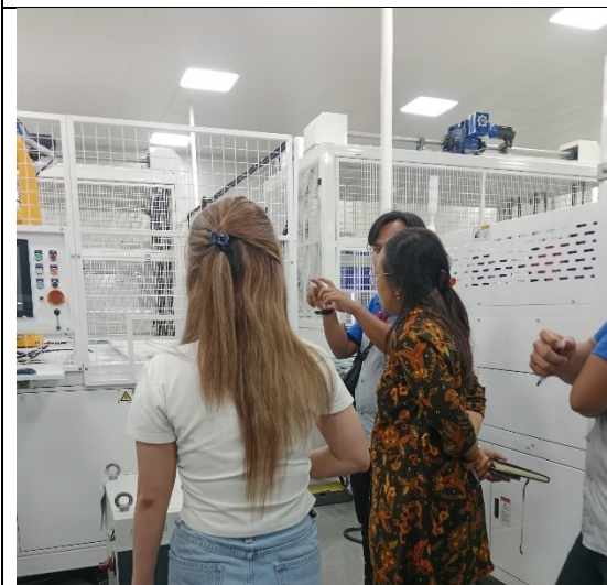
Gb 3. Praktek Audit Internal