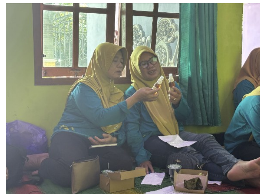
Gambar 4. Hasil Spray