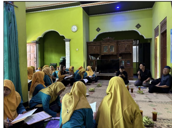
Gambar 2. Pengisian Post test