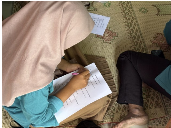
Gambar 1. Pengisian Pre test

pengetahuan dan keterampilan. Dokumentasi pengisian pre test dan post test dapat dilihat pada gambar dibawah ini: