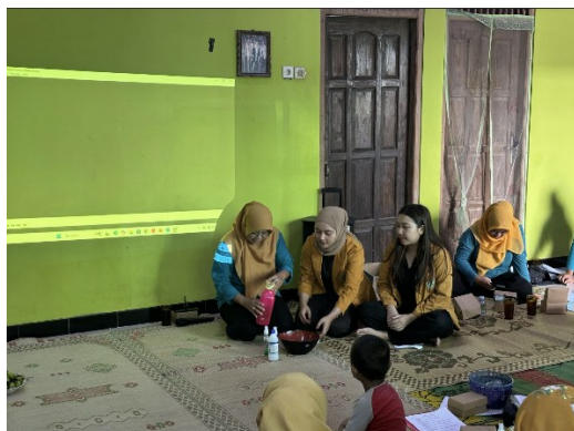
Gambar 3. Proses pencampuran bahan

Evaluasi terhadap dampak pelatihan menunjukkan adanya peningkatan yang signifikan dalam aspek pengetahuan dan keterampilan peserta. Dokumentasi pelatihan dapat dilihat pada gambar berikut ini: