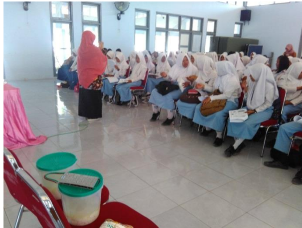
Gambar 3. Praktek pembuatan tepung Mocaf

Proses pembuatan mocaf yang diajarkan mengacu pada metode yang dilakukan Putri (2018). Langkah awal yang dilakukan yaitu pengupasan ubi kayu menggunakan pisau dengan tujuan untuk memisahkan kulit ubi kayu. Selanjutnya, ubi kayu yang telah dikupas dicuci dengan menggunakan air untuk menghilangkan kotoran yang menempel pada permukaan ubi kayu. Pada proses ini dihasilkan limbah cair sisa proses pencucian. Setelah ubi kayu bersih, ubi kayu tersebut dipotong tipis-tipis menggunakan mesin slicer sehingga berbentuk chip . Chips tersebut kemudian dilakukan proses fermentasi. Proses fermentasi merupakan tahapan yang penting, yang tidak dilakukan pada proses pembuatan tepung biasa.