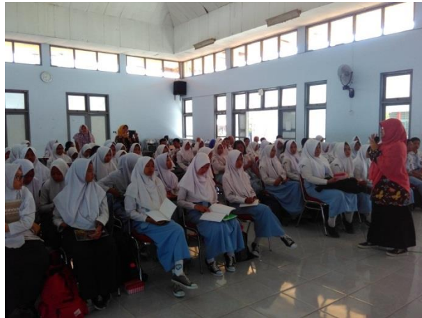
Gambar 2. Kegiatan penyuluhan tentang diversifikasi pangan

Evaluasi dilakukan dengan pelaksanaan pre test (test awal) dan post test (test akhir) setelah kegiatan penyuluhan dilakukan, dan dilakukan sampling terhadap 50 peserta. Hasil pretest menunjukkan sebagian besar mendapatkan skor di bawah 70. Jika menggunakan nilai rata-rata, hasil test awal peserta mendapatkan nilai rata-rata 60 kemudian hasil test akhir rata-rata peserta mendapatkan nilai 85,5. Seluruh peserta yang mengikuti posttest mendapatkan skor \geq 70 , yang berarti terjadi peningkatan pengetahuan peserta setelah pelaksanaan kegiatan. Hasil ini menunjukkan bahwa kegiatan telah berhasil dilaksanakan karena sesuai dengan indikator keberhasilan penyuluhan yaitu terjadi peningkatan skor menjadi \geq 70 (Tabel 2).