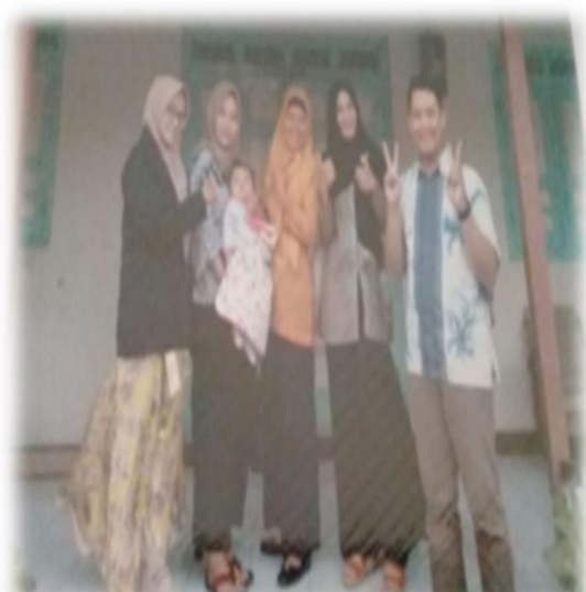
Foto Bersama Peserta dan Ibu Pengurus PKK Dusun Kodokan