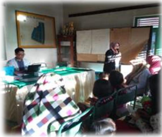
Foto Diskusi dan Tanya Jawab