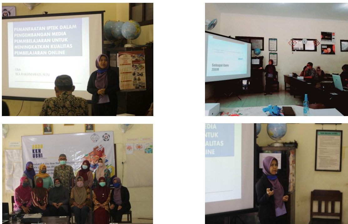
Gambar 2. Kegiatan Pengabdian Masyarakat

Kegiatan pada sesi ke 2 tersebut sangatlah menarik dimana para guru sangat antusias untuk belajar megoperasikan aplikasi tersebut, ada beberapa guru yang mengalami kesulitan dalam mempratikkan tetapi hal tersebut dapat di terselesaikan karena adanya pendampingan penuh dalam kegiatan ini, dimana ada permasalahan, disitu langsung diatasi. Kegiatan berlangsung secara tertib, aman dan lancar.