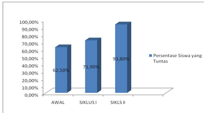
Gambar 2. Persentase Ketuntasan Siswa pada Kondisi Awal, Siklus I, dan Siklus II

Berdasarkan grafik di atas dapat ditunjukkan bahwa prestasi belajar siswa dengan menerapkan pembelajaran model kooperatif tipe TPS di setiap putaran mengalami peningkatan, yaitu: (1) Sebelum dilakukan tindakan penelitian kelas nilai rata-rata prestasi