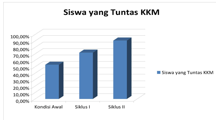
Gambar3.Diagram persentase ketuntasan siswa siklus 1

Berdasarkan hasil observasi yang dilakukan, siswa terlihat belum percaya diri saat mengerjakan soal-soal yang diberikan oleh guru. Berkaitan dengan materi yang disampaikan, nampaknya siswa sudah memiliki gambaran mengenai masalah seni musik tradisional Nusantara untuk disajikan secara perorangan dan kelompok di kelas atau di sekolah. Setelah dilihat hasil dari latihan yang diberikan, sudah ada peningkatan jika dibandingkan dengan kondisi awal sebelum diadakan penelitian siklus 1, dari nilai rata-rata yang awalnya hanya 70,1 meningkat menjadi 75,2, tetapi masih kurang dari indikator yang diharapkan yaitu 80. Persentase ketuntasan siswa yang awalnya hanya 53,1%, pada siklus 1 dapat meningkat menjadi 71,8%, tetapi masih belum memenuhi indikator kinerja yaitu sebesar 85%. Tindakan siklus kedua ini terdapat 4 jam pelajaran (2 kali pertemuan), yaitu hari jumat, 2 dan 9 Maret 2018 jam ke-3 s.d 4 (pukul 08.20-09.00 dan 09.15-09.55). Pada tindakan kedua materi yang digunakan adalah Menyajikan karya seni musik tradisional Nusantara untuk disajikan secara perorangan dan kelompok di kelas atau di sekolah. Berdasarkan hasil pengamatan di dalam kelas dan hasil latihan siswa pada siklus kedua, peningkatan yang terjadi sudah sesuai indikator kinerja yang diharapkan yaitu, nilai rata-rata kelas minimal 80 dan ketuntasan minimal 85%, Berdasarkan hasil tersebut, maka penelitian sudah dapat dinyatakan selesai.