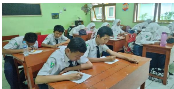
Gambar 1. Pembelajaran menulis cerkak secara konvensional di MTsN Kota Madiun

Untuk memberikan gambaran yang lebih jelas mengenai transformasi proses pembelajaran, berikut disajikan perbandingan dokumentasi antara metode konvensional dan penggunaan media blog . Dokumentasi ini menunjukkan perbedaan signifikan pada media yang digunakan serta tingkat antusiasme siswa dalam mengikuti pembelajaran menulis cerkak . Gambar 1, merupakan suasana pembelajaran menulis cerkak dengan metode konvensional; siswa fokus pada penulisan manual yang cenderung monoton dan hasil karya siswa memiliki keterbatasan dalam hal publikasi dan jangkauan pembaca. Gambar 2, menunjukkan transformasi pembelajaran menggunakan media blog , siswa tampak lebih antusias mengeksplorasi teknologi digital dalam berkarya sastra Jawa. Suasana pembelajaran menulis cerkak menjadi inovatif dan menyenangkan menggunakan media blog .