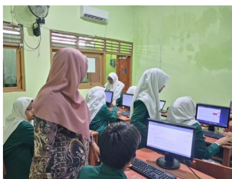
Gambar 2. Pembelajaran menulis cerkak menggunakan media blog di MTsN Kota Madiun

Setelah praktik menulis cerkak di blog , siswa diberi pertanyaan tentang pengalamannya menulis cerkak . Berikut hasil jawaban siswa, 1) Coba ceritakan pengalaman Anda saat pertama kali diminta menulis cerkak di sekolah. Bagaimana perasaan Anda saat itu? Jawabannya antara lain; sangat senang, senang, biasa, antusias, ragu, biasa aja, excited , kaget, gugup, saya senang karena dapat menceritakan sedikit pengalaman/cerita saya dahulu, senang karena akhirnya aku bisa menceritakan beberapa pengalaman ceritaku, senang dan bahagia dan menambah pengalaman baru bagi saya dan dapat menambah ilmu baru tentang menulis cerkak , saya mendapat pengalaman baru, sangat senang karna pengalaman pertama saya, saat pertama kali diminta menulis cerkak di sekolah, saya merasa campur aduk antara gugup dan penasaran.