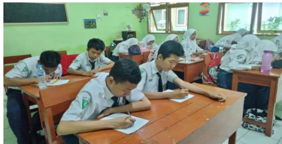
Gambar 1. Pembelajaran menulis cerkak secara konvensional di MTsN Kota Madiun

Untuk memberikan gambaran yang lebih jelas mengenai transformasi proses pembelajaran, berikut disajikan perbandingan dokumentasi antara metode konvensional dan penggunaan media blog . Dokumentasi ini menunjukkan perbedaan signifikan pada media yang digunakan serta tingkat antusiasme siswa dalam mengikuti pembelajaran menulis cerkak . Gambar 1, merupakan suasana pembelajaran menulis cerkak dengan metode konvensional; siswa fokus pada penulisan manual yang cenderung monoton dan hasil karya siswa memiliki keterbatasan dalam hal publikasi dan jangkauan pembaca. Gambar 2, menunjukkan transformasi pembelajaran menggunakan media blog , siswa tampak lebih antusias mengeksplorasi teknologi digital dalam berkarya sastra Jawa. Suasana pembelajaran menulis cerkak menjadi inovatif dan menyenangkan menggunakan media blog .