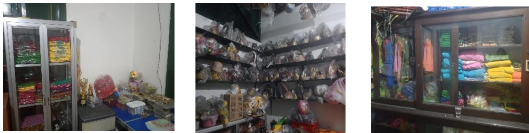
Gambar 4. Koleksi kostum,property, dan perhiasan tari

Sebagai implementasi strategi tersebut, Sanggar Soerya Soemirat membuka akses pelatihan secara luas kepada masyarakat dengan sistem pendaftaran yang relatif sederhana, yaitu melalui pendaftaran langsung di lokasi sanggar. Biaya yang dikenakan untuk pelatihan sebesar Rp50.000,00 per bulan. Peserta didik dapat bergabung mulai usia minimal lima tahun, dan jumlahnya terus mengalami peningkatan seiring waktu, baik dari segi kuantitas maupun kualitas kemampuan (wawancara Kurniati, 23 Februari 2026). Proses pembelajaran juga didukung oleh fasilitas yang memadai, meliputi pelatih profesional yang berasal dari abdi dalem Pura Mangkunegaran serta akademisi dan alumni Institut Seni Indonesia (ISI), ruang latihan di Bangsal Prangwedanan Pura Mangkunegaran, serta sarana pendukung seperti kostum, properti, perhiasan tari, dan perangkat musik. Aksesibilitas ini menjadi salah satu bentuk adaptasi sanggar dalam mempertahankan daya tarik seni tradisional di tengah kompetisi dengan budaya global yang semakin terbuka.