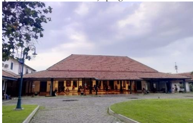
Gambar 1. Lokasi Sanggar Soerya Soemirat (Bangsal Prangwedanan Pura Mangkunegaran)

Seiring meningkatnya kebutuhan penguatan pembelajaran tari tradisional, pada tahun 1992 dilakukan penataan organisasi yang membagi menjadi Sanggar Soerya Soemirat (berfokus pada tari tradisional) dan Sanggar Kinarya Soerya Soemirat (berorientasi pada tari kreasi), yang menandai transformasi dari kelompok tari menjadi lembaga pendidikan seni yang lebih terstruktur (wawancara Kurniati, 23 Februari 2026). Penamaan “Soerya Soemirat” berkaitan dengan Himpunan Kerabat Mangkunegaran Suryosumirat, sedangkan “Kinarya” mencerminkan semangat berkarya dalam pengembangan seni tari (Prabowo et al., 2007; Astarinny, 2025). Dalam perkembangannya, sanggar yang awalnya berorientasi pada kebutuhan internal Mangkunegaran kemudian membuka akses bagi masyarakat umum, sehingga berfungsi sebagai wadah pendidikan sekaligus pelestarian tari tradisional, dengan pergeseran dari pengajaran tari kreasi menuju penguatan identitas tari tradisional.