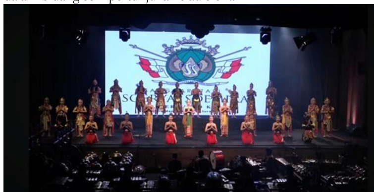
Gambar 3. Sanggar Soerya Soemirat pada Festival Wayang Nasional 2023 “Asthdharmakarta” di Semarang

Selain keterlibatan di lingkungan Mangkunegaran dan panggung pertunjukan lokal, Sanggar Soerya Soemirat juga aktif mengikuti berbagai festival, seperti Festival Wayang Bocah. Dalam beberapa kesempatan, sanggar memperoleh prestasi yang mencerminkan kualitas pembinaan serta kemampuan peserta didik dalam menguasai materi pertunjukan. Keikutsertaan tersebut tidak hanya memperkuat reputasi sanggar, tetapi juga menjadi bagian dari upaya pelestarian seni pertunjukan melalui proses regenerasi generasi muda. Berdasarkan wawancara, Sanggar Soerya Soemirat secara rutin berpartisipasi dalam Festival Wayang Bocah dan kerap meraih penghargaan, bahkan pada periode tertentu hanya dilibatkan sebagai pengisi acara karena capaian prestasi yang relatif dominan (wawancara Kurniati, 23 Februari 2026). Kondisi tersebut menunjukkan konsistensi sekaligus kualitas pembinaan yang dilakukan sanggar dalam bidang seni pertunjukan tradisional.