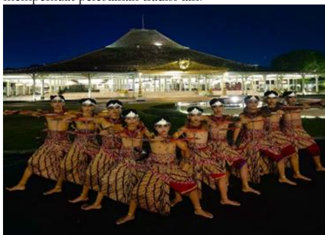
Gambar 2. Tari Jemparingan oleh Sanggar Soerya Soemirat pada acara Beksan Setu Pon

Keterlibatan Sanggar Soerya Soemirat dalam berbagai kegiatan seni berlangsung secara rutin dan berkelanjutan, khususnya di lingkungan Pura Mangkunegaran. Sanggar ini secara konsisten terlibat dalam berbagai agenda budaya, seperti Mangkunegaran Night Market (MNM), Tingalan Jumenengan, pesta rakyat, serta kegiatan rutin Setu Pon. Keterlibatan tersebut menunjukkan bahwa keberadaan sanggar tidak terpisahkan dari dinamika pertunjukan seni di lingkungan Mangkunegaran (wawancara Mauritius, 15 April 2026). Selain itu, sanggar juga berpartisipasi dalam kegiatan berskala lebih luas, termasuk acara internasional, sebagai penyedia penari sesuai kebutuhan pertunjukan. Hal ini menegaskan posisi Sanggar Soerya Soemirat sebagai mitra kultural dalam mendukung penyelenggaraan kegiatan seni sekaligus memperkuat pelestarian tradisi tari.