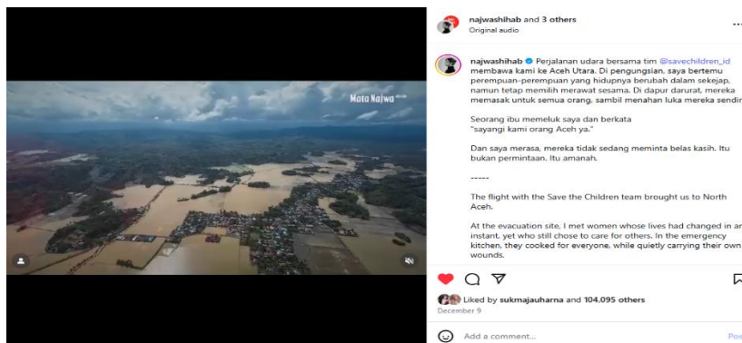
Gambar 5. Deskripsi singkat pada 9 Desember 2025

“Perjalanan udara bersama tim @savechildren_id membawa kami ke Aceh Utara. Di pengungsian, saya bertemu perempuan-perempuan yang hidupnya berubah dalam sekejap, namun tetap memilih merawat sesama. Di dapur darurat, mereka memasak untuk semua orang, sambil menahan luka mereka sendiri. Seorang ibu memeluk saya dan berkata “sayangi kami orang Aceh ya.” Dan saya merasa, mereka tidak sedang meminta belas kasih. Itu bukan permintaan. Itu amanah.”