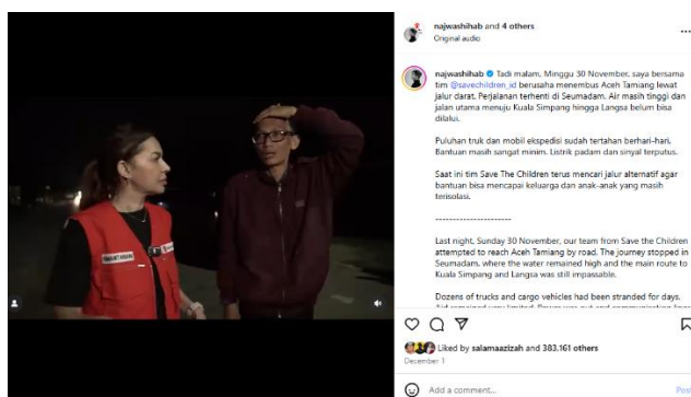
Gambar 1. Deskripsi singkat pada 1 Desember 2025

“Tadi malam, Minggu 30 November, saya bersama tim @savechildren_id berusaha menembus Aceh Tamiang lewat jalur darat. Perjalanan terhenti di Seumadam. Air masih tinggi dan jalan utama menuju Kuala Simpang hingga Langsa belum bisa dilalui.