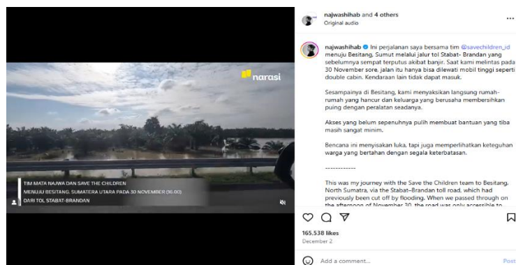
Gambar 2. Deskripsi singkat pada 2 Desember 2025

“Dari pengungsian korban banjir di Seumadam, para ibu menceritakan bagaimana mereka menyelamatkan diri, meninggalkan rumah yang kini tinggal puing. Bantuan masih sedikit, namun syukur mereka tetap besar. Anak-anak tetap bermain, seakan ingin menunjukkan bahwa harapan bisa tumbuh bahkan di tempat yang paling sulit. Sebelum saya melangkah pergi, seorang anak bertanya, “Kakak kaya ya?”--tiba-tiba membuat saya terdiam sejenak. Jika Anda ingin membantu, dukungan dapat disalurkan melalui @savechildren_id. Setiap bantuan, sekecil apa pun, sangat berarti bagi anak-anak di sini.”