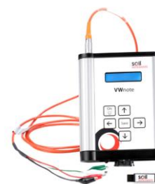
Gambar 2. Data Logger (unit alat baca)