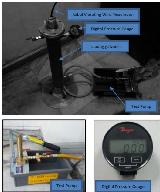
Gambar 3. Peralatan Chamber (Cell bertekanan)