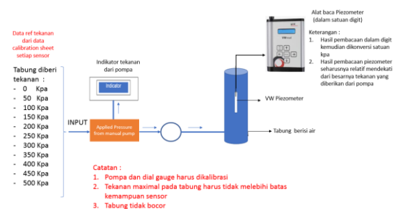
Gambar 4. Skema kalibrasi metode chamber