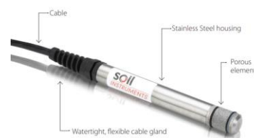
Gambar 1. Tips Piezometer

Sedangkan untuk peralatan pada metode chamber adalah Tips Piezometer tipe W9 vibrating wire piezometer (SN 078205) , unit alat baca AVW200 data logger yang diproduksi oleh Soil instrument limited , unit peralatan chamber untuk tempat pengetesan tips, Pressure Gauge Digital tipe DY600 yang diproduksi oleh HangZhou DongYa Instrument (yang disertai sertifikat kalibrasi), pompa untuk pengaturan tekanan, serta peralatan pendukung lainnya. Lokasi pelaksanaan adalah di kantor direksi Pembangunan Bendungan Jragung.