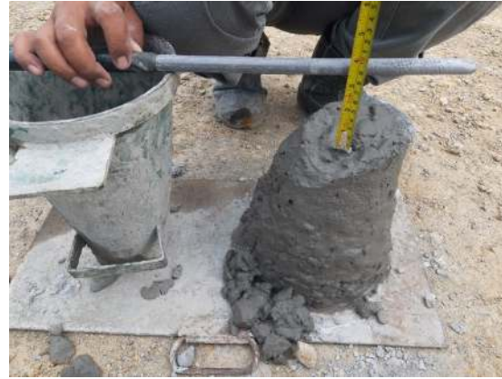
Gambar 2. Slump Test

Dari beton inovasi yang telah dibuat, dilakukan pengujian slump dan diperoleh hasil slump sebesar 10 cm. Hasil pengujian dapat dilihat pada gambar dibawah ini :